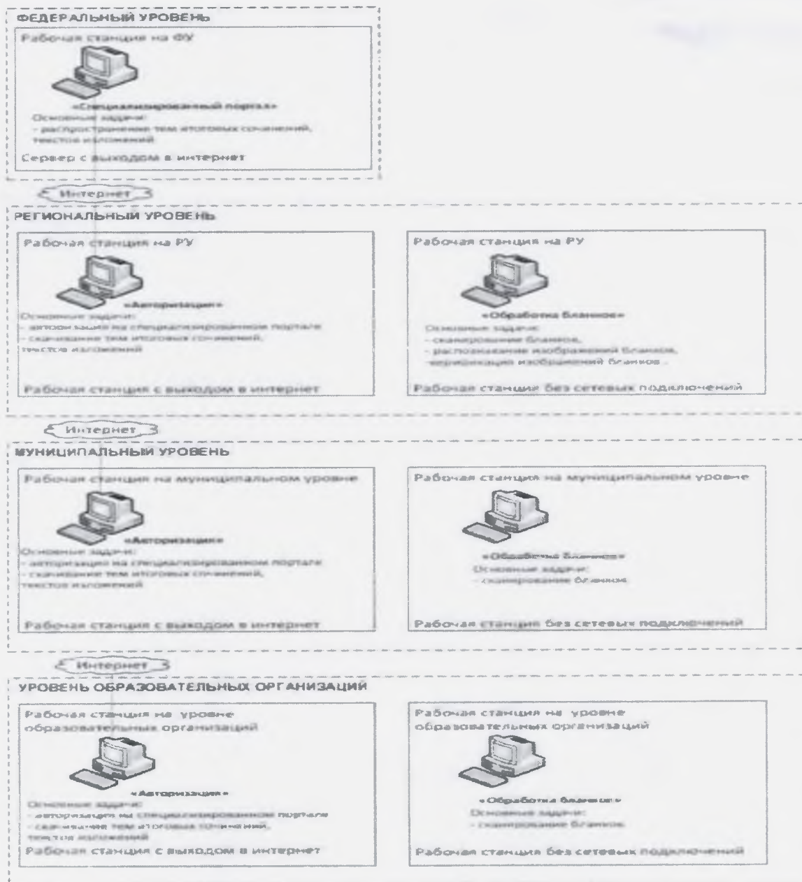
Рисунок 1. Архитектура и состав ПО

Схема ПО, используемого для проведения итогового сочинения (изложения), приведена на рисунке (см. Рисунок 1). На схеме приведены только новые или значительно модернизированные по сравнению со стандартной технологией проведения ЕГЭ модули и подсистемы. Требования к техническому и программному оснащению рабочих станций